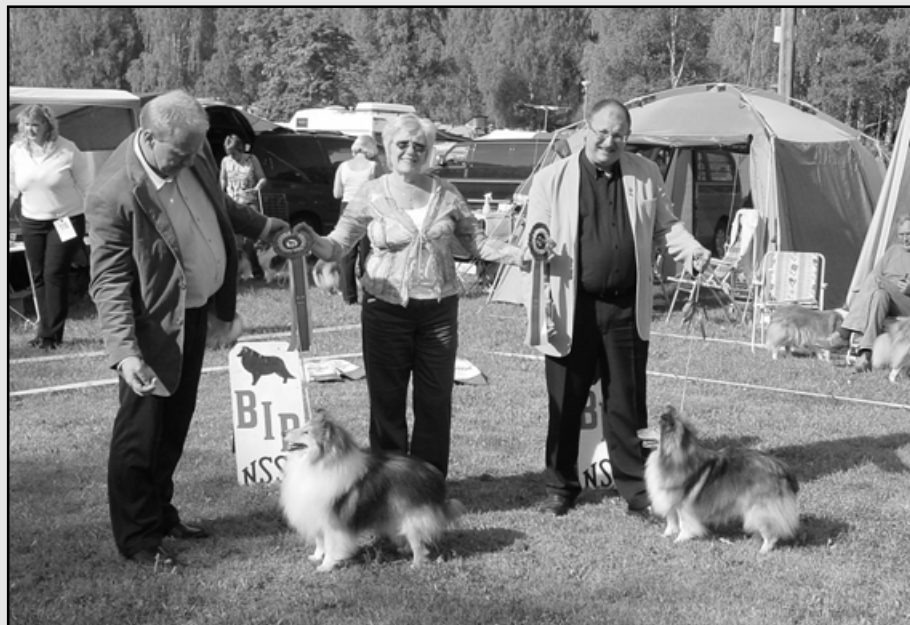
BIR Veteran Amethrickeh's Magican