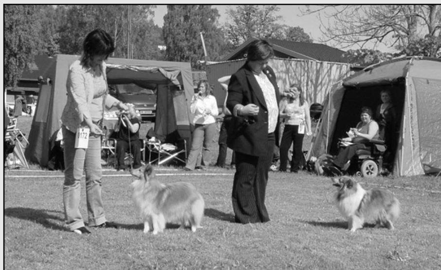
3AKK Kathimer`s Amazing Star