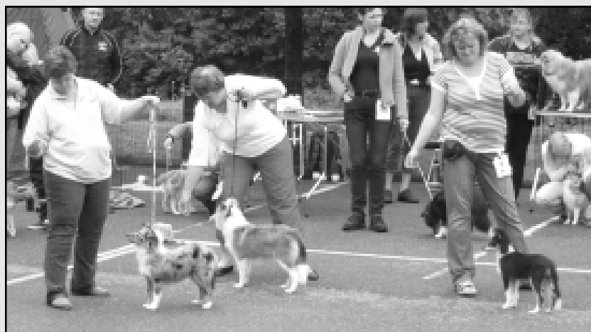
Fra v.: Scarlet-Red's Unique Blue Turbo, Imaferrari's King Kong, Catoma's For Your Eyes Only