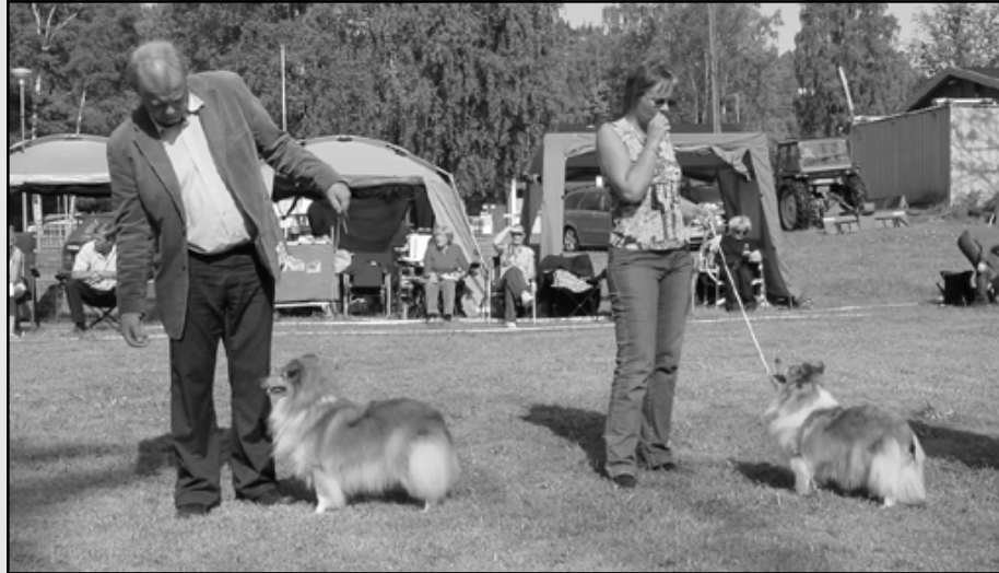
1CHKK Lundecock's Waterlily,