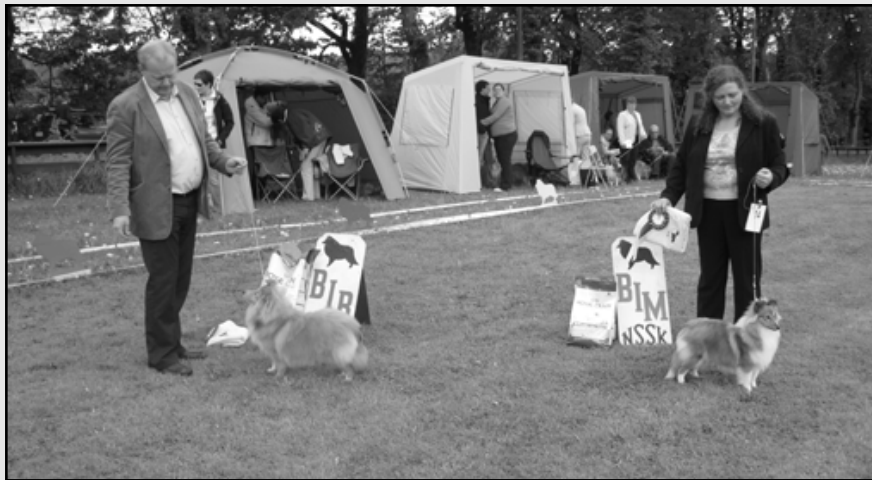
BIR-valp: Lundcock's Brig O Doon og BIM-valp: Kathimer's Barbara Streisand