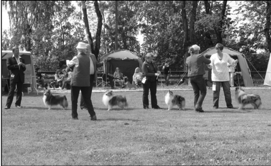
Bildet over, fra venstre: 1KVAL 1CHKK CK 1BHK BIR Edglonian the Real Mc Coy, 1KVAL 1VETKK CK 2BHK CERT Ametrickeh's Magician, 1KVAL 1AKK CK 3BHK Microgården's Heavenly Blue, 1KVAL 1UKK CK 4BHK La-Min-So's Blue Silver Otto.