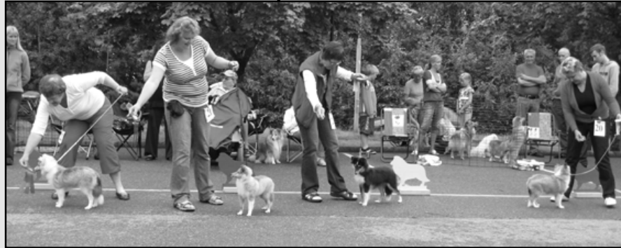
Fra v.:(1) Imaferrari's Key To The Rainbow,(2) Imaferrari's Kickshaw, (3) Ankidanki's Maria, (4) Ingivito's Jocular Bibi