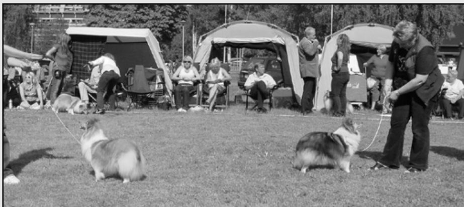
1AKK Japaro Laced With Silk