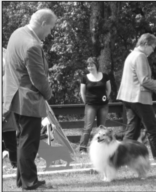
Vinner av klassen: GB Ch S Uch Amethrickeh's Magican