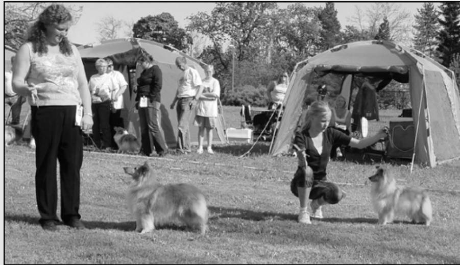
3CHKK Kelroes Fabolous Attention,