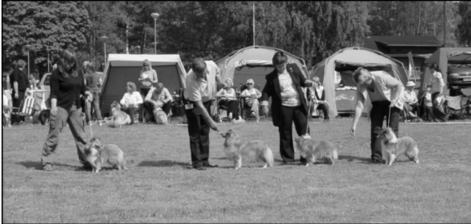
1 JKK Roikie`s Something Wonderful, 2 JKK Mainland`s Timberly, 3 JKK Lyngvetun`s Famous Ferrari, 4 JKK North Sheltie`s Wine N Roses