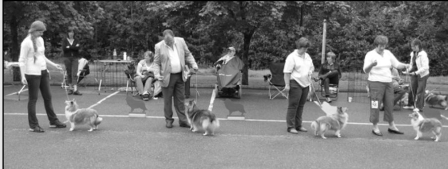
Fra v.: (1) Karmell's Little Mouse, (2) Hasimo's Adorable Pearl, (3) Imajan's La Gioia Ferrari, (4) Dunbrae Wish Upon A Rainbow