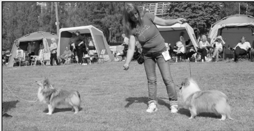
Fra venstre: 2AUKK Leeland Queen of Art, 1AUKK Croft`s Roll Over Lay Down