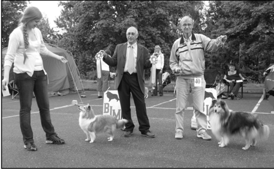
Fra v.: BIM: Karmell's Little Mouse,