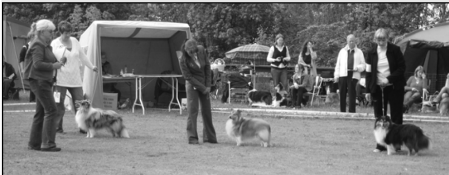
(1) La-Min-So's Blue Silver Otto, (2) Sheldon Serio Comic, (3) Leeland Quarterback