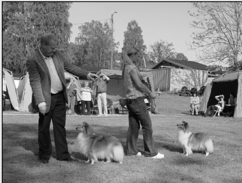
1BTK Japaro Laced With Silk, 2BTK Lundecock`s Waterlily