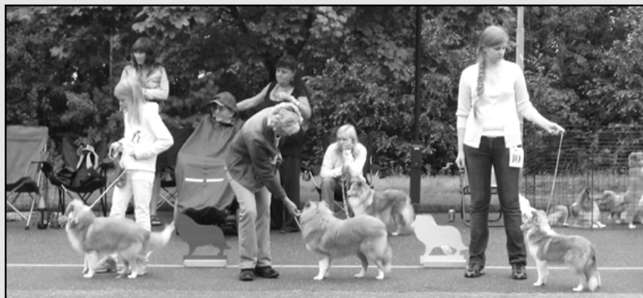
Fra v. : Leeland Viceroy, Sheltiemoon's Elton John, Dalemoor D'Legend