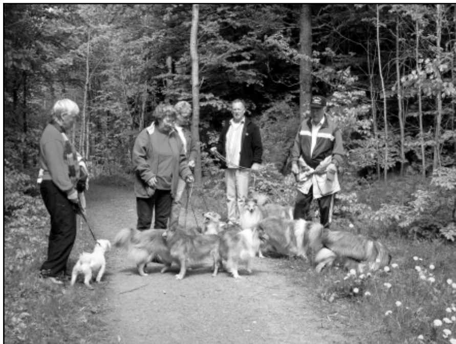
To og firbente koser seg på dilt i Bøkeskogen 20. mai 2007