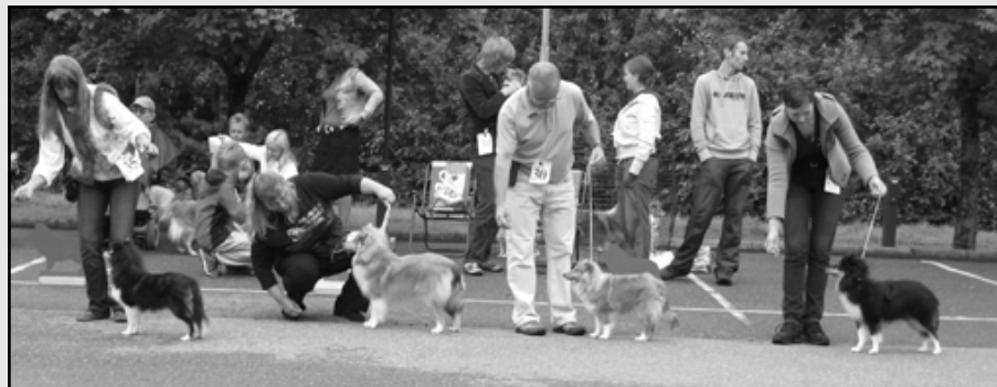
Croft's I Want, Imaferrari's Inside The Rainbow, Croft's Wild Wine, Imaferrari's Innocent Rainbow