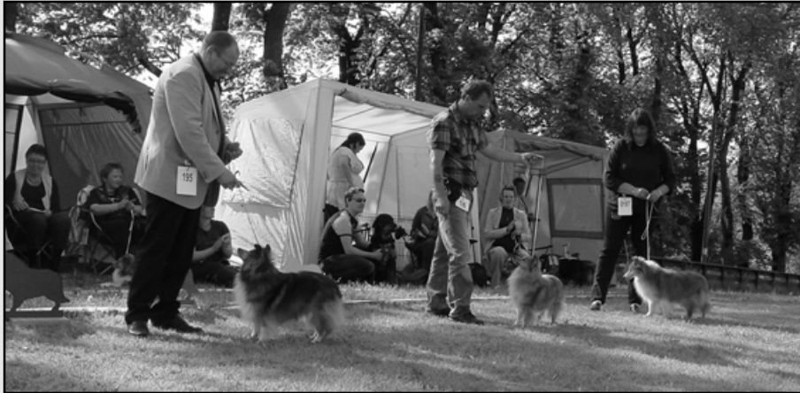
1VETKK Hasimo`s Adorable Pearl, 2VETKK Imajan`s La Gioia Ferrari, 3VETKK Ingramay Sunshine