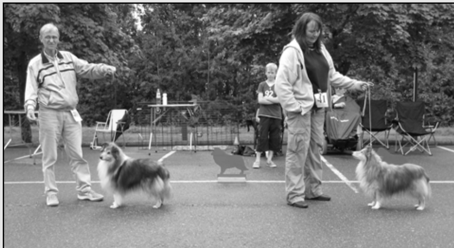
Fra v.: Karmell's Scero Little Boy,