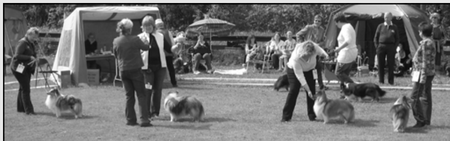
(1) Microgården's Heavenly Blue, (2) Minnlett's Blue Temptation, (3) Catoma's Boy of Scotch (4) Shelridge Starmaker