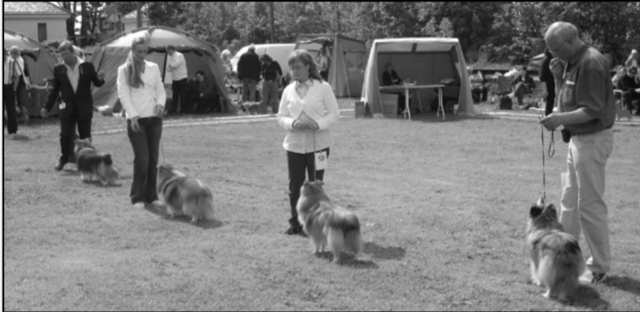
(1) GB S N UCH Edglonian the Real Mc Coy, (2) NUCH Lundecock's Fiddler on the Roof, (3) N UCH Croft's Brown Sugar, (4) N UCH Mainland's O'Boy