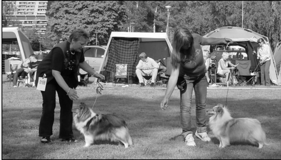
4BTK Orean Rose Royal