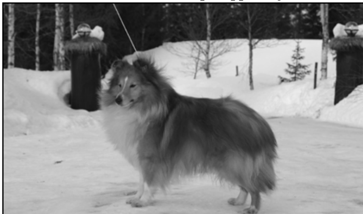
Doonelodge Lunar Landing "Andy" (S Fin Uch Rannerdale Moonwalker - Yorvik Margareta Time at Doonelodge)