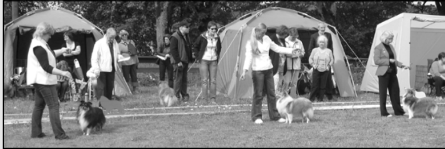
(1) Minnlett's Good Looking, (2) Blazefield Hard Rock Cafe, (3) Tunmark's Pride And Joy