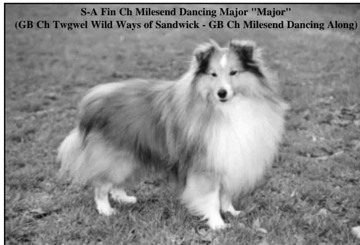
S-A Fin Ch Milesend Dancing Major "Major" (GB Ch Twgwel Wild Ways of Sandwick - GB Ch Milesend Dancing Along)