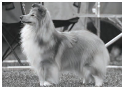
Nord JV-07-Nord V-07-SV-08 Lundcock's Hoity-Toity