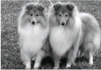
Beste i parklasse i Vilsta.