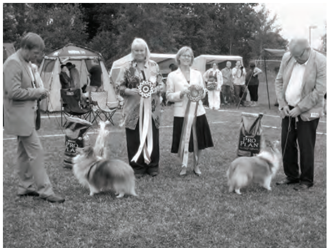
BIR-BIM-Vilsta. BIM-CH Lun- decocck's Fiddler On The Roof -BIR -Nord JV-07-Nord V-07- SV-08 Lundecock's Hoity-Toity