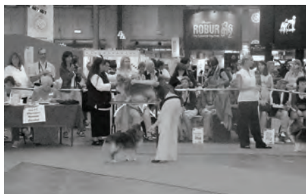
Stemmingsbilde fra ringen