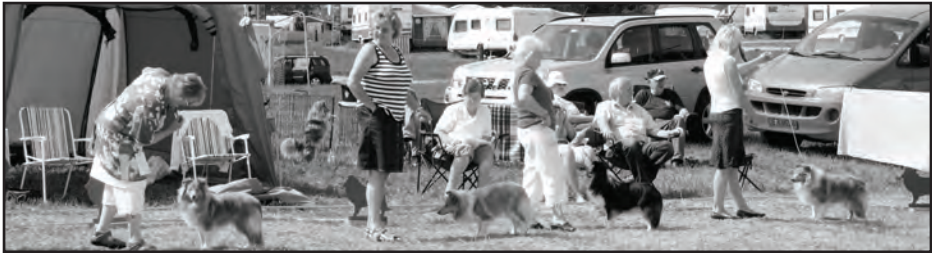
Juniorklasse tisper, ELVARHEIM'S SCHANGRI LA, MELLSJØHØGDA'S AIN'T SHE SPECIAL, MICROGÅRDEN'S MAKE A WISH, JOYLAND'S CUTE ENOUGH