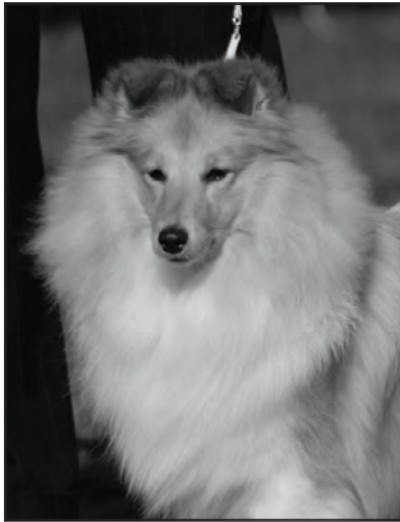
Catoma`s Guardian Angel "Kaisa" 10 mnd