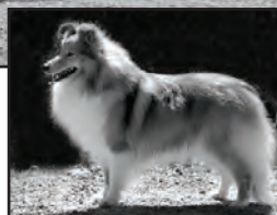
"Zoe" (over) og kull-søster "Beauty" (under)