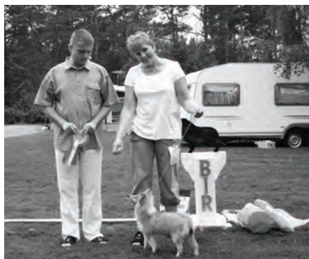
BIR valp ble Sheltievik's Golden Rose

En Stor takk til alle tre som gjorde en flott jobb.