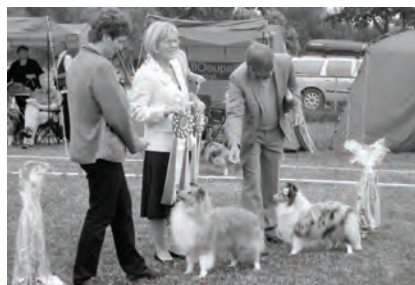
BIR-BIM Junior: BIR-Shellrick's You May Me Luck BIM - Croft's And Justice For All