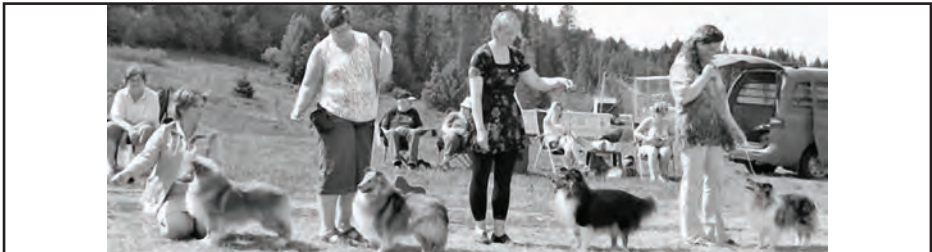
Åpen klasse hannhund, NORDJV-06 WINDCREST STORM FORCE, IMAFERRARI'S XZACKT, LEELAND QUARTERBACK, MICROGÅRDEN'S HEAVENLY BLUE