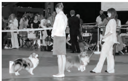
Verdensutstillingen - Cert Beste jr, JW Degallo The Real Deal og res.Cert-Eastflash Glamorous Blue Line