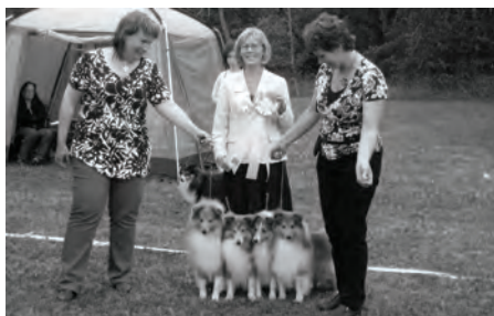
Beste oppdrettergruppe Vilsta - kennel Shellrick