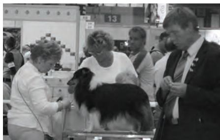
Den siste finpussen.