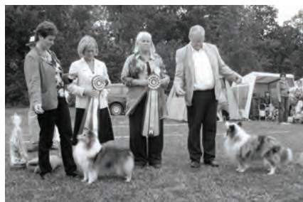
BIR-BIM Veteran Vilsta BIR-Shellrick's Joyful Jasmine BIM-SUCH Lundcock's Favourite Flame