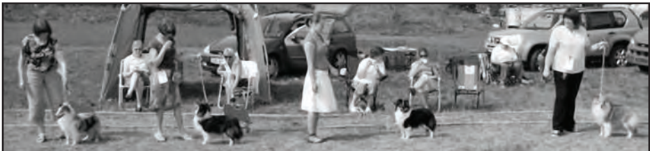
Unghundklasse tisper, TIAKINA TALKBLUE AT THOCO, IMAFERRARI'S HIGH AND LOW, MELLSJØHØGDA'S VISION OF TTRUST, MELLSJØHØGDA'S WINTER SURPRICE