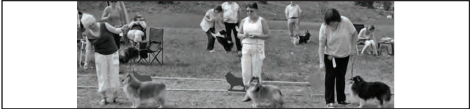
Unghundklasse hannhund, MICROGÅRDEN'S LOOK THIS WAY, RIVERGATE'S ONE IN THE MILLION, BLACKSIDE THE MOON DE MAYERLING,