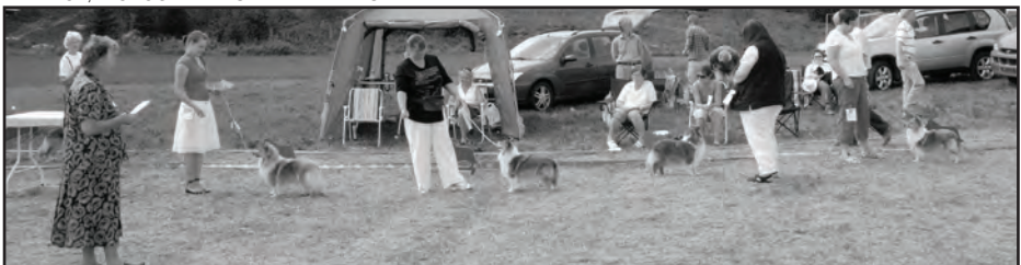
Åpen klasse tisper, BØENGEN'S ENYA, IMAFERRARI'S WALK THE RAINBOW, EASTDALE MOON DREAM, IMAJAN'S NORWEGIAN RAINBOW,,