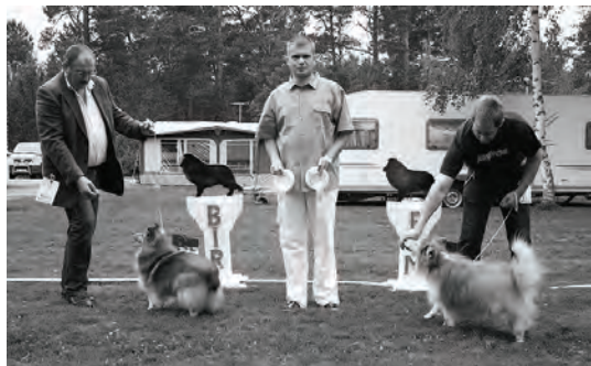
BIR veteran Hasimo's Adorable Pearl & BIM Cingaro's Nick