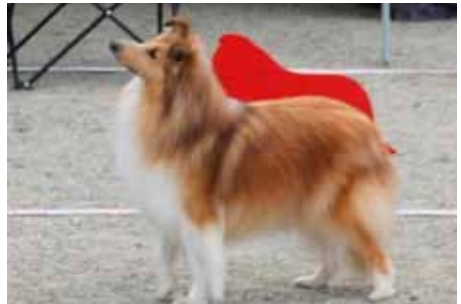
Kathimer's Amazing Star