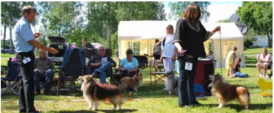
Vinnere Veteranklasse hannhund