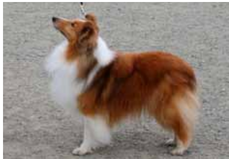
North Sheltie's Golden Autumn