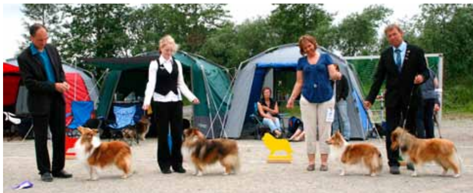
Beste oppdretterklasse North Sheltie