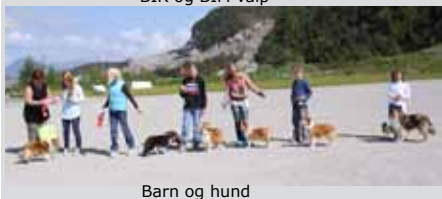
Barn og hund