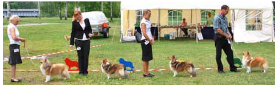
Vinnere Championklasse tisp