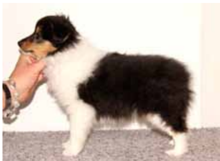
Tispevalp 7 uker med fin helhet og nydelige tegninger

Konstruksjonsmessig ser jeg etter valpen som er lett å stille opp på bord, som har beina korrekt plasserte på bakken, som har god brystkorg og gode bakbeins- vikler, god nakke, ikke for lang og ikke for kort i kroppen. Beinstammen bør være passelig, og med ganske korte haser. Helhetspreget til valpen bør være litt søtt og "bamsete" uten å virke grovt.