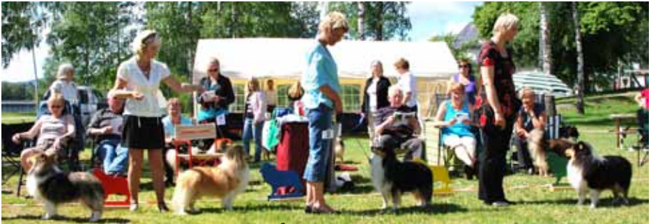
Vinnere Åpen klasse hannhund