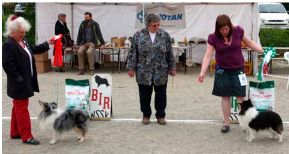
BIR og BIM