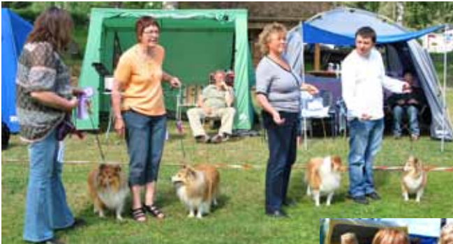
Beste oppdretterklasse: Mellsjøhøgda