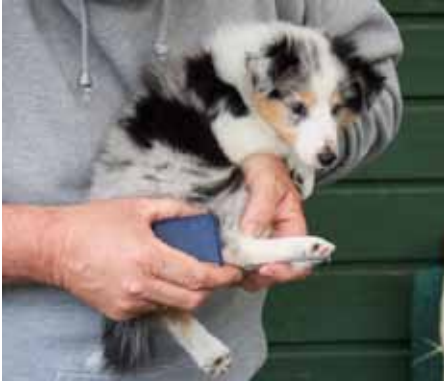
Måling av haser