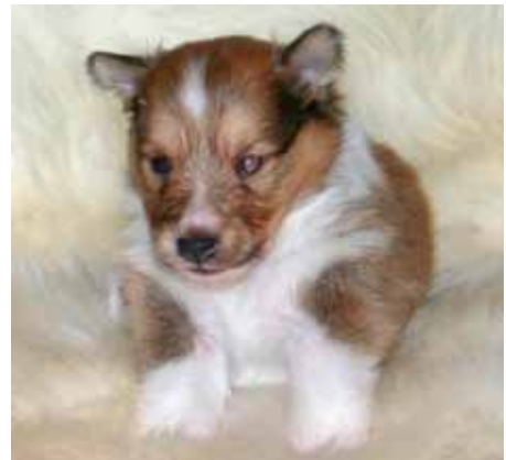
4 ukers valp med røde blitz-øyne, øyenlyst på 8 uker med CRD

Man kan få visse indikasjoner på øye-resultat ved å fotografere valpene rett forfra med digitalkamera i et mørkt rom. Får man fram røde øyne så har valpen høyst sannsynlig CEA, men får man fram klart blått skjær i øynene så er valpen høyst sannsynlig fri (man må gjerne ta mange bilder for å få fram resultat). Jeg har drevet med dette i flere år og har ennå ikke bommet ifht offisielle resultater.