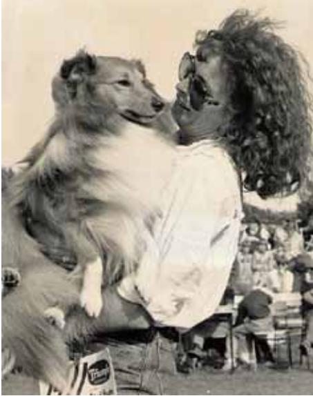
Rosco med glad matmor/handler ved NKKs int utst i Moss 1982 etter å ha vunnet Selskaps-hundgruppen

gå videre da vi måtte ta farvel med ham 14 år gammel. Han hadde en lang svulst på siden av halsen og denne dukket ikke opp før han var 13 år gammel. En veterinær ville at vi skulle fjerne svulsten men en annen var enig med oss i at "man ikke skulle operere en så gammel hund".