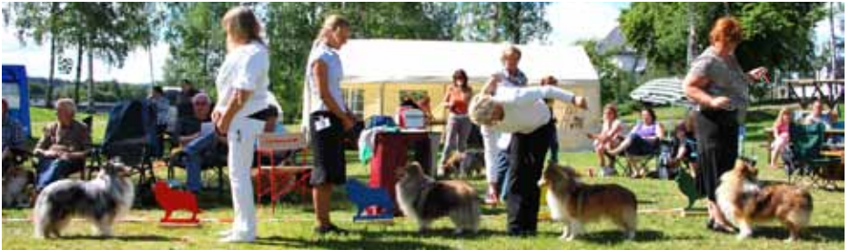
Vinnere Championklasse hannhund