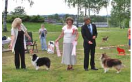
BIR og BIM veteran