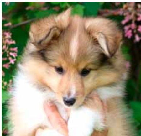
Hannvalp 8 uker, pent uttrykk med tette, mandelformede øyne

Det gode sheltieuttrykket kan være vanskelig å definere på en valp. Jeg ser etter valpen med de litt tette, mandelformede, ikke for store øynene, god øyefarge og god pigmentering rundt øynene. Valpen med de nette, bra ansatte ørene, ikke for små, ikke for store, og vipp som buer naturlig. Stoppen bør være godt definert.