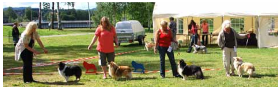
Vinnere Veteranklasse tisp