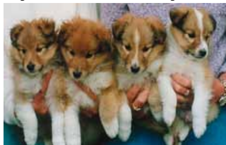
F.v.: Nr. 1 og nr.4 ble champions, nr. 2 ble max størrelse og ck vinner, nr. 3 ble altfor stor.