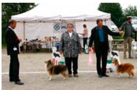
BIR og BIM veteran