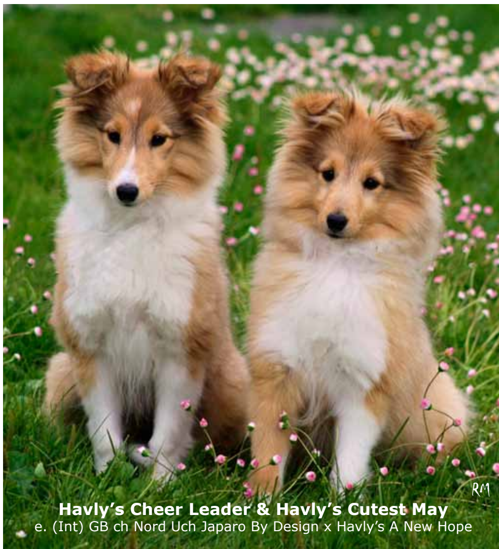
Havly's Cheer Leader & Havly's Cutest May e. (Int) GB ch Nord Uch Japaro By Design x Havly's A New Hope