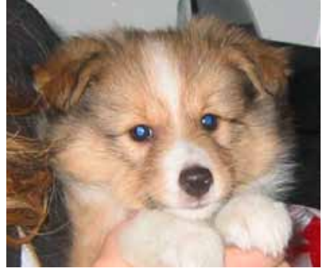
8 ukers valp med klart blåskjær i øynene, frilyst på 9 uker