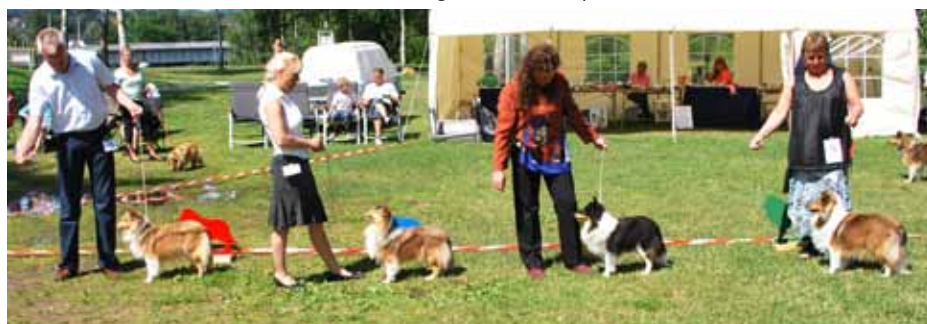
Vinnere Åpen klasse tisp