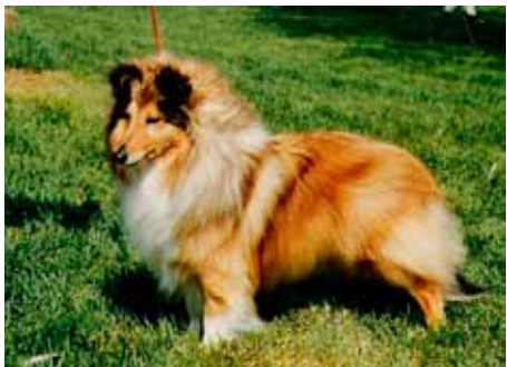
En av Rosco's 27 champion avkom: Int N S Uch Leeland Ring-Around-A-Rosy (datter av N Uch Leeland Ring My Chanel). Rosco var dominant for sobel.