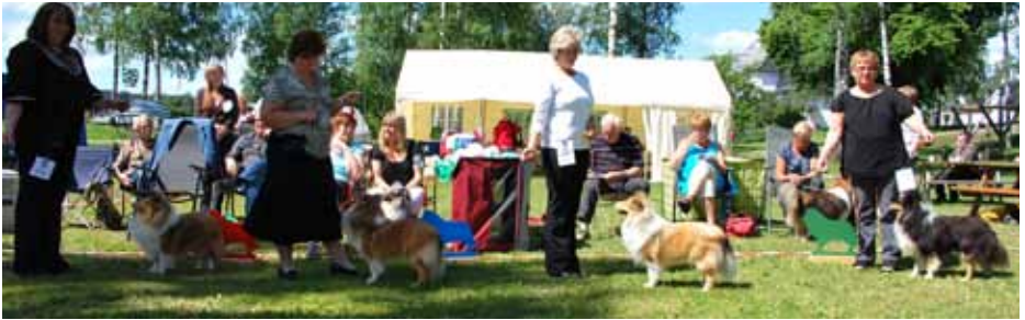
Vinnere Unghundklasse hannhund