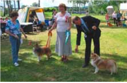
BIR og BIM junior