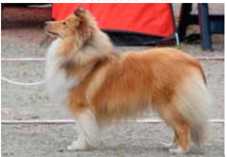
Lyngvetun's Just A Ferrari