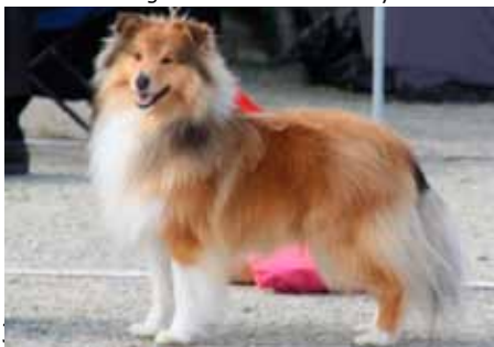
North Sheltie's The Piano Man