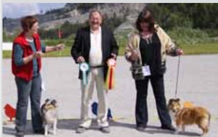
BIR og BIM valp