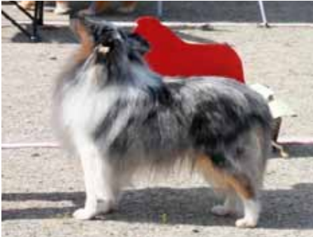
Microgårdens Heavenly Blue