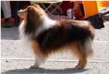
Ch Karmell's Scero Little Boy