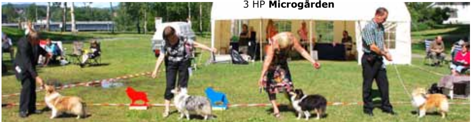
Vinnere Juniorklasse tisper

1 HP Mellsjøhøgda 2 HP Lyngvetun 3 HP Microgården