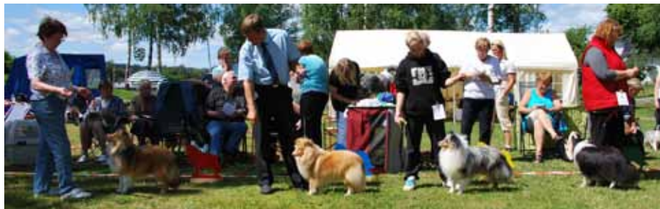
Vinnere Juniorklasse hannhund

2VETK HP INT NORD UCH Marnham Montanner (S-A FIN CH Milesend Dancing Major ex Kelrove Wanda To Marnham)