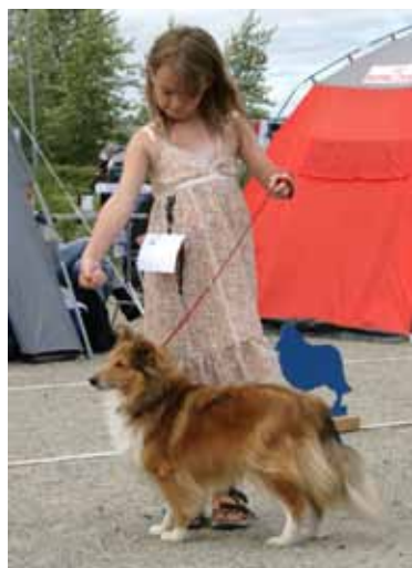
Vinner av Barn og hund Dommer: Anne Haugstvedt, North Sheltie