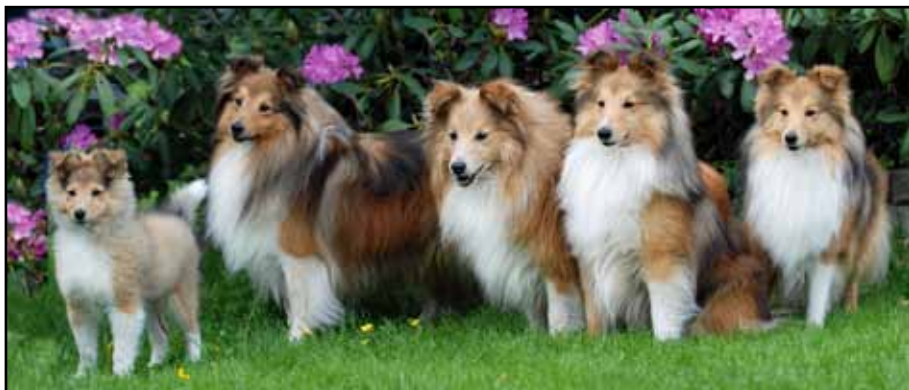
Leeland Impress 3 mndr, N Ch Lythwood Scrumpy Jack 6 år, N Ch Stornaway Sawney Bean 12 år, Shelridge Starmaker 7 år og hans datter N Ch Leeland Queen Of Art "Zoe"