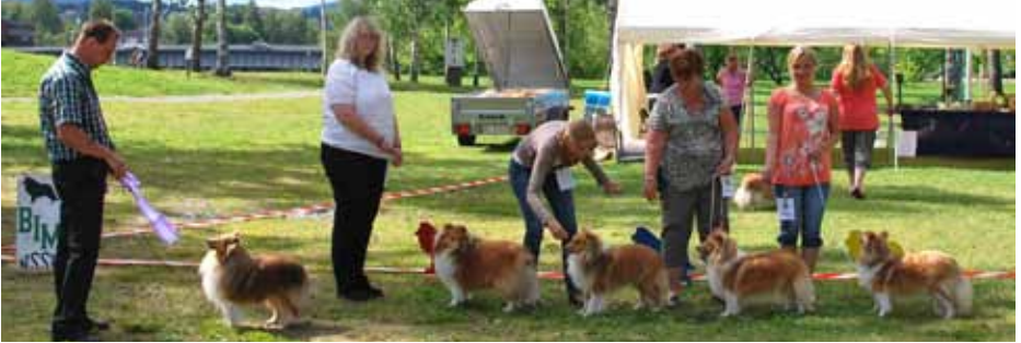
Beste avlsklasse: Ch Sommerville Scottish Boy