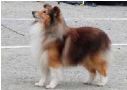
Ch Edglonian The Real McCoy