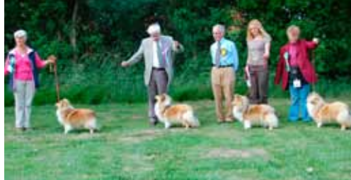
ESSC Open Show: f.v Hannhund lineup, tisper lineup