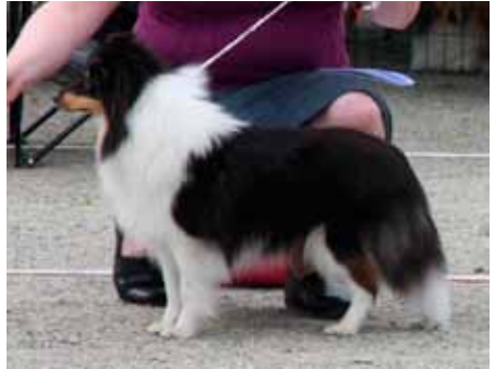
Kathimer's Coco Chanel