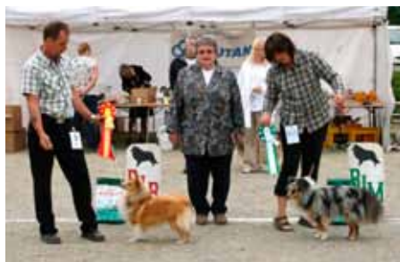
BIR og BIM junior