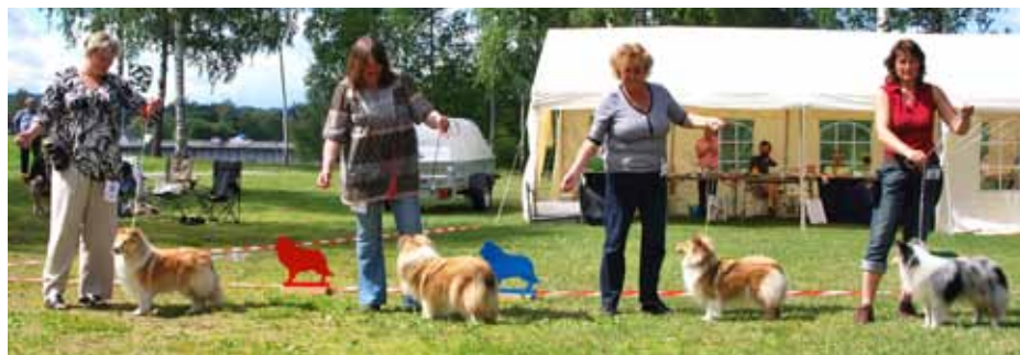
Vinnere Unghundklasse tisp