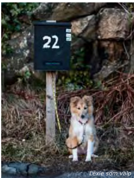
Lexie som valp