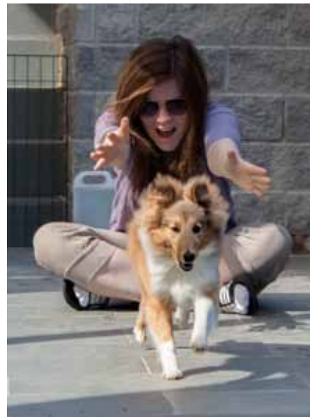
Fart og spenning .....

Mari og Lexie er to helt forskjellige hunder, til tross for at de er mor og datter. Mari er, og har alltid vært rolig, ikke av den veldig lekne typen. Lek som belønning har aldri vært godt nok, men hvis du har klar en godbit derimot, da er hun veldig fornøyd.