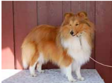
Kjanto's Frozen Kristoffer (Memus Professor Higgins ex N UCH Croft's A Kind Of Magic)