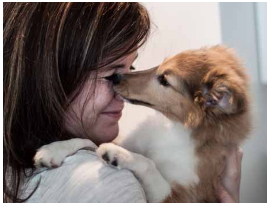
..... men kan kose av og til

De to er som sheltier flest veldig glad i å gå tur. Da er vi heldige som har gode turmuligheter i Bergen. Man ser hvordan de koser seg i fjellet, og de oppsporer enhver vann- og gjørmepytt som er å finne. Ikke alltid like fine når de kommer tilbake, men det er da verdt det.