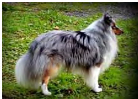
Lillevolden Amazing Ice Blue Amigo (Poulsgaards Contador In Blue ex Poulsgaards Shes Got The Look)