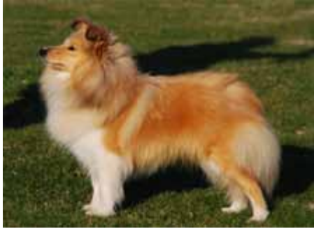
Kikkiathy's X Factor In Love (ES UCH Rannerdale Lord Charles ex Croft's Sun Is Shining)