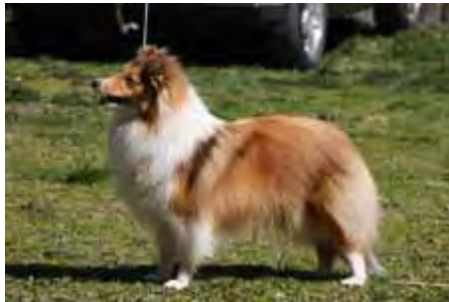
Kjanto's Frozen Anna (Memus Professor Higgins ex N UCH Croft's A Kind Of Magic)