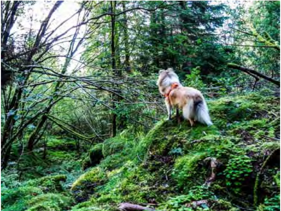
Lexie pønser ut neste sprell