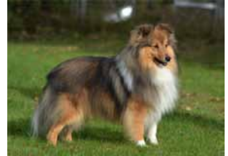
Lundecock's Speed Limit (SE DK FI Ch Tachnamadra The Designer ex Lundecock's Rainbow Lily)