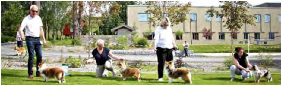
Plassering tispervalper 6-9 mnd