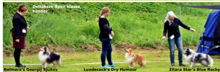
Deltakere Åpen klasse hanner