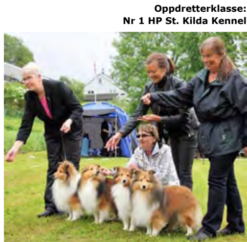
Oppdretterklasse: Nr 1 HP St. Kilda Kennel