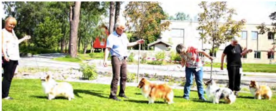
Plassering BHK: Minshelties Brad Paisley, Kjanto's Frozen Kristoffer, Ch La-min-so's Ladies Knight, Ch Orreknuppen's Very Special