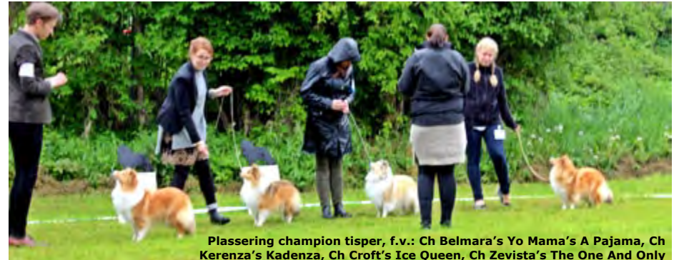
Plassering champion tisper, f.v.: Ch Belmara's Yo Mama's A Pajama, Ch Kerenza's Kadenza, Ch Croft's Ice Queen, Ch Zevista's The One And Only