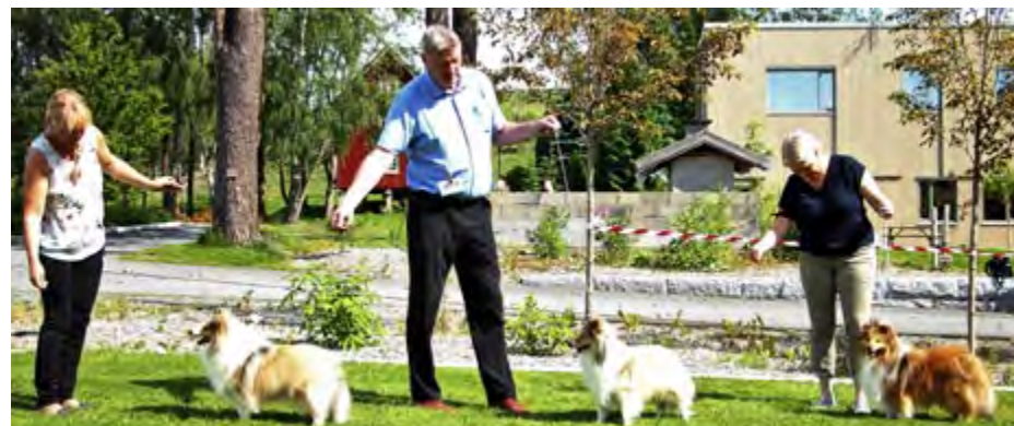
Unghund hanner: Minshelties Brad Paisley, Minshelties Cloud Of Dust, A Boy Named Bjor Av Revehiet