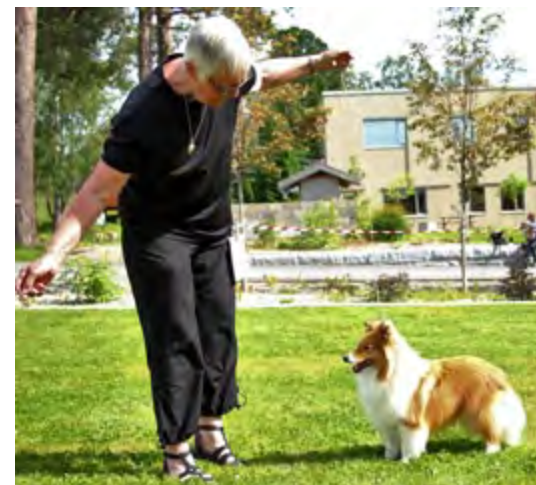
Junior hanne: Orreknuppen's All I Want Is You