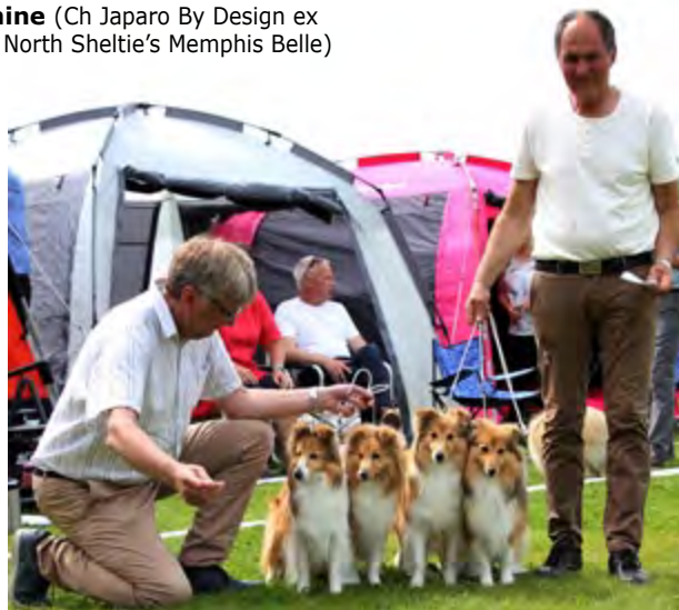
Kennel North Sheltie, beste oppdretterklasse