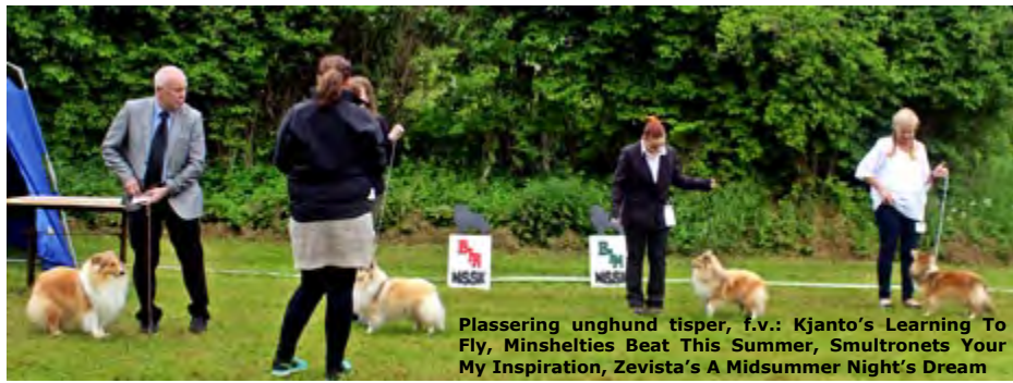
Plassering unghund tisper, f.v.: Kjanto's Learning To Fly, Minshelties Beat This Summer, Smultronets Your My Inspiration, Zevista's A Midsummer Night's Dream