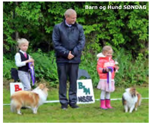
Barn og Hund SØNDAG