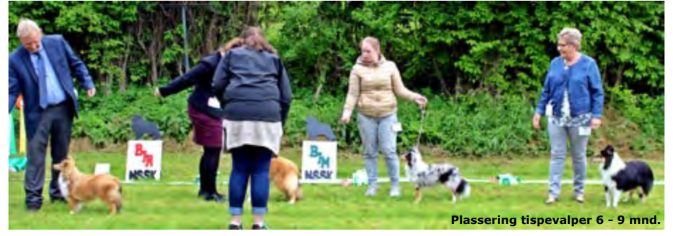
Plassering tispervalper 6 - 9 mnd.