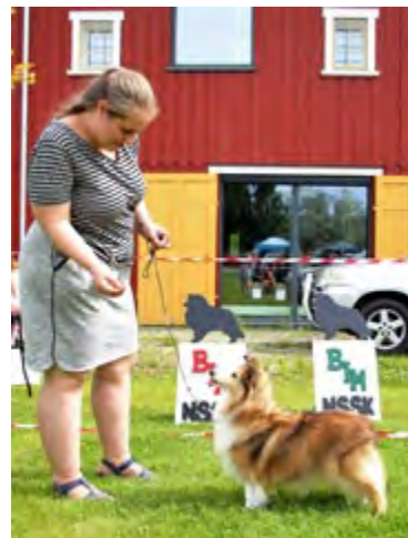
BIR-Veteran: Leeland Unique Charm