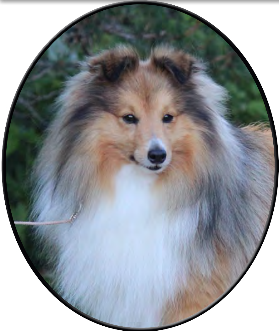
N UCH Orreknuppen's Very Special (Bob) (Orreknuppen's Starmaker & Orreknuppen's Hadila)