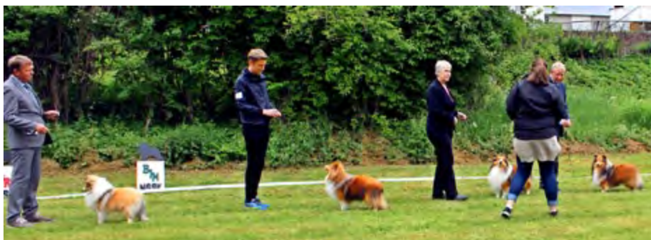
Plassering BHK, f.v.: Minshelties Brad Paisley, Ch Lundcock's Speed Limit, Ch St. Kilda's Legend In Time, Ch St. Kilda's Notorious