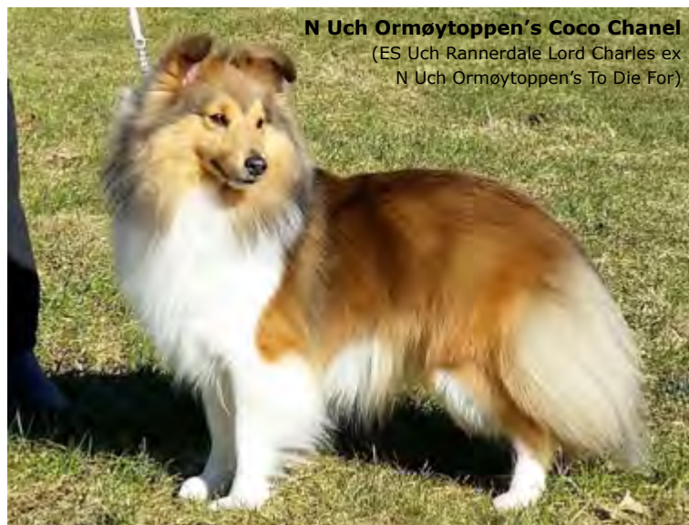
N Uch Ormøytoppen's Coco Chanel (ES Uch Rannerdale Lord Charles ex N Uch Ormøytoppen's To Die For)