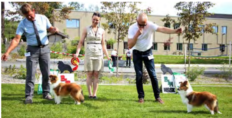
f.v. BIR-Valp: Ormøytoppen's Sweet Music Man BIM-Valp: Ormøytoppen's Blaze Of Glory