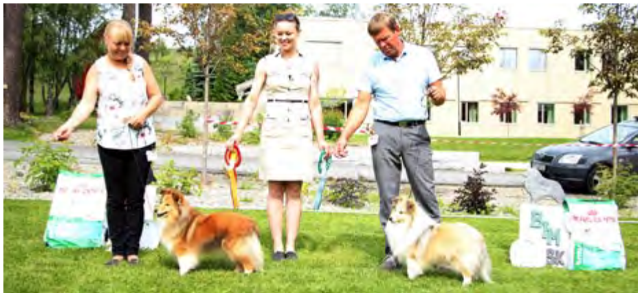
f.v. BIR: INT NORD UCH NORDV-12 SEV-12 KBHV-12 NV-16 Joyland's Magic Ambition BIM: Minshelties Brad Paisley