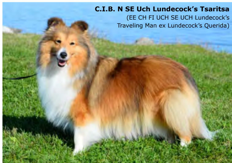
C.I.B. N SE Uch Lundecock's Tsaritsa (EE CH FI UCH SE UCH Lundecock's Traveling Man ex Lundecock's Querida)

Ormøyveien 54, 4085 Hundvåg Mob. W: 99260839 / J: 90837425. Mail: wenche.vikoren@lyse.net