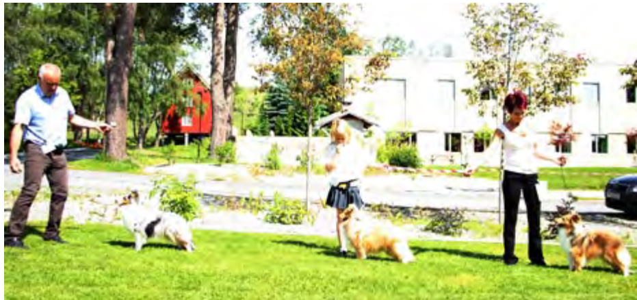
Juniorklasse tisper: Shelteam Who's That Girl, Smultronets The Winner Takes It All, Joyland's Made My Day