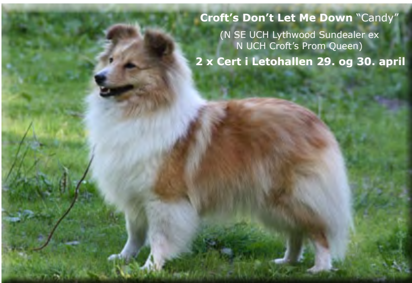
Croft's Don't Let Me Down "Candy"

(N SE UCH Lythwood Sundealer ex N UCH Croft's Prom Queen)