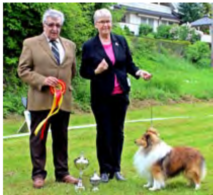
BIR-Veteran: Ch St. Kilda's Legend In Time