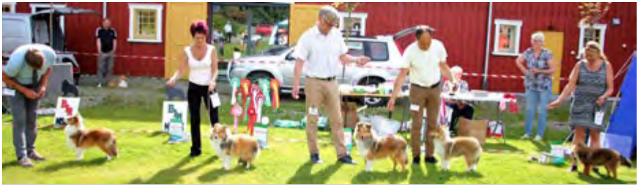
Plassering hannvalper 6-9 mnd