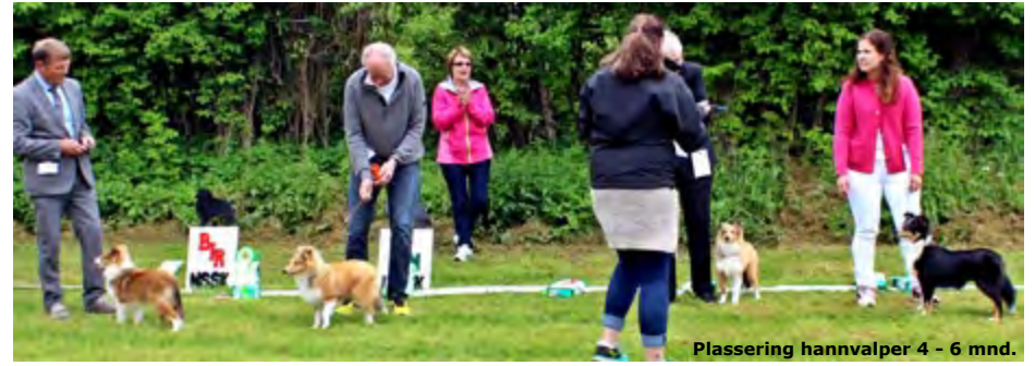
Plassering hannvalper 4 - 6 mnd.