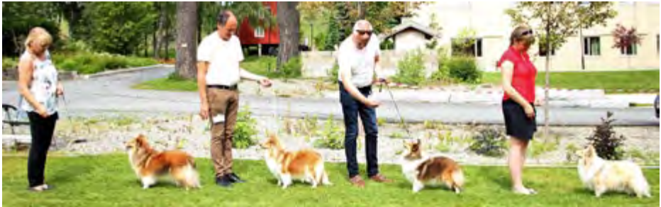
Plassering BTK: Ch Joyland's Magic Ambition, North Sheltie's Gemstone, Ch Ormøytoppen's Coco Chanel, Minshelties Beat This Summer