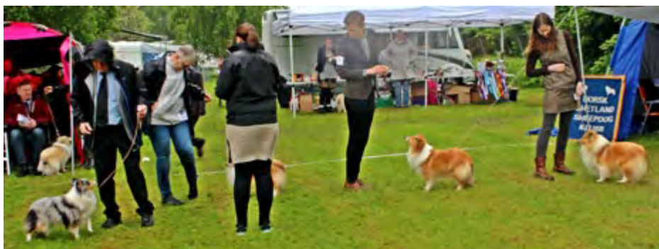
Plassering BTK, f.v.: Shelteam Who's That Girl, Kjanto's Frozen Elsa, Ch Belmara's Yo Mama's A Pajama, Kjanto's Learning To Fly