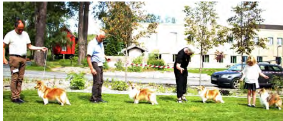
Åpen klasse tisper: North Sheltie's Gemstone, Kjanto's Frozen Elsa, Orreknuppen's Sweet As Honey, Zitara Star's Charisma