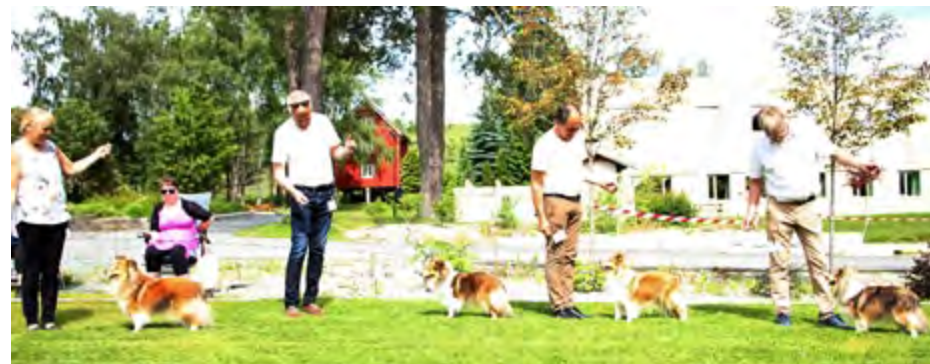
Champion klasse tisper: Ch Joyland's Magic Ambition, Ch Ormøytoppen's Coco Chanel, Ch North Sheltie's Fire N Ice, Ch North Sheltie's Indian Summer