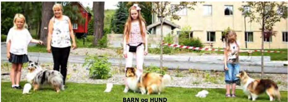
BARN og HUND