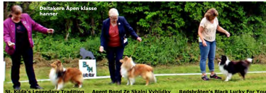
Deltakere Åpen klasse hanner