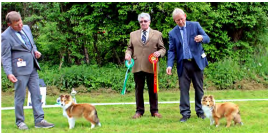
f.v: BIM-valp: Ormøytoppen's Sweet Music Man og BIR-valp: Lillevolden Funny Fighting Star