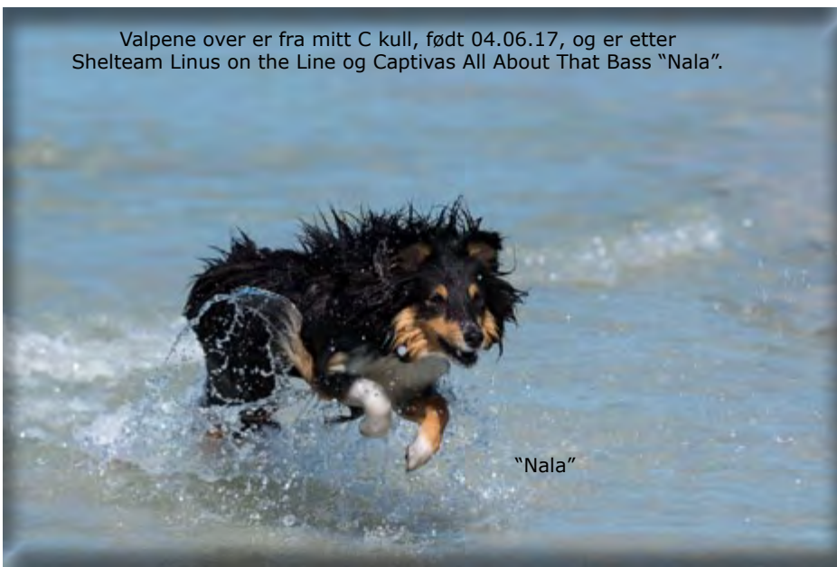
Valpene over er fra mitt C kull, født 04.06.17, og er etter Shelteam Linus on the Line og Captivas All About That Bass "Nala".