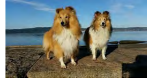
Angel og Lykke koser seg på tur :)