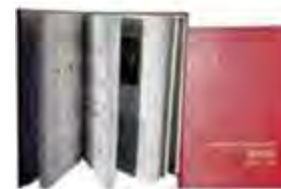
Årbok 2006 - 2010 - 480 sider i farger - kr 100,-

1 bok sendt som A-post koster kr. 380,- inkl. porto/emb. Bestiller man 2 til 8 bøker til samme adresse, koster porto og emballasje kr. 180,- i tillegg til bøkene som koster kr. 250,- pr. stk.