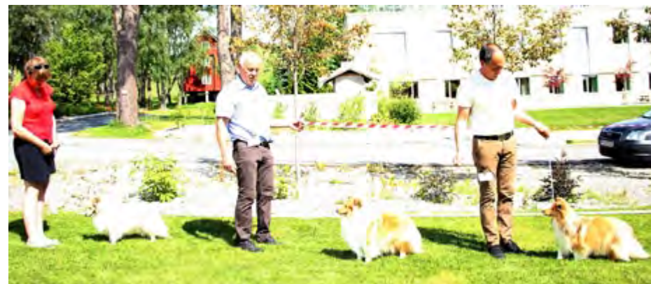
Unghund tisper: Minshelties Beat This Summer, Kjanto's Learning To Fly, North Sheltie's Fame N Fortune