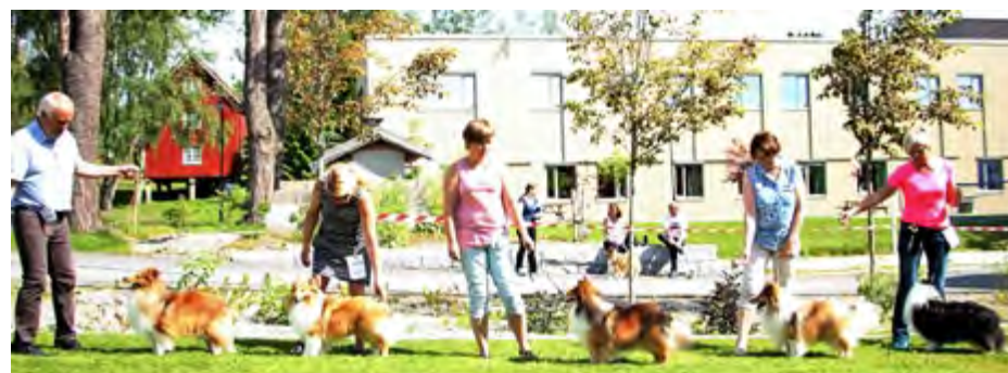
Åpen klasse hanner: Kjanto's Frozen Kristoffer, Orreknuppen's Wonderful Showman, Sheltievik's Kindly Ziko, Orreknuppen's Unique One, Thoco's Casanova De Neri