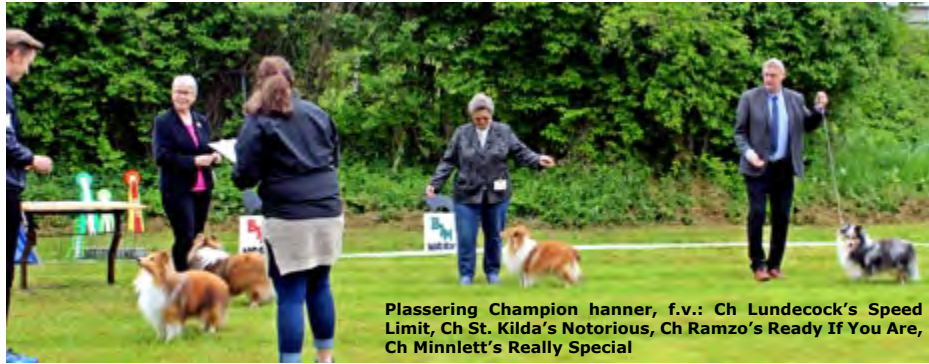
Plassering Champion hanner, f.v.: Ch Lundcock's Speed Limit, Ch St. Kilda's Notorious, Ch Ramzo's Ready If You Are, Ch Minnlett's Really Special