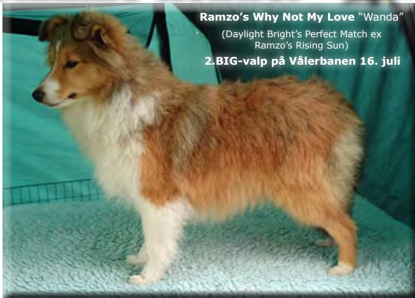
Ramzo's Why Not My Love "Wanda"

(Daylight Bright's Perfect Match ex Ramzo's Rising Sun)