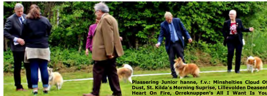
Plassering Junior hanne, f.v.: Minshelties Cloud Of Dust, St. Kilda's Morning Suprise, Lillevolden Deasent Heart On Fire, Orreknuppen's All I Want Is You