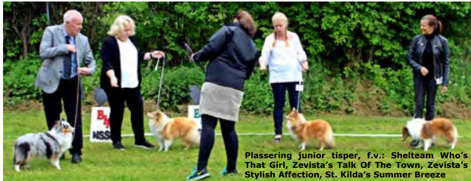
Plassering junior tisper, f.v.: Shelteam Who's That Girl, Zevista's Talk Of The Town, Zevista's Stylish Affection, St. Kilda's Summer Breeze