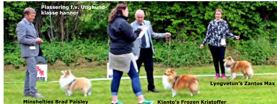
Plassering f.v. Unghund-klasse hanner