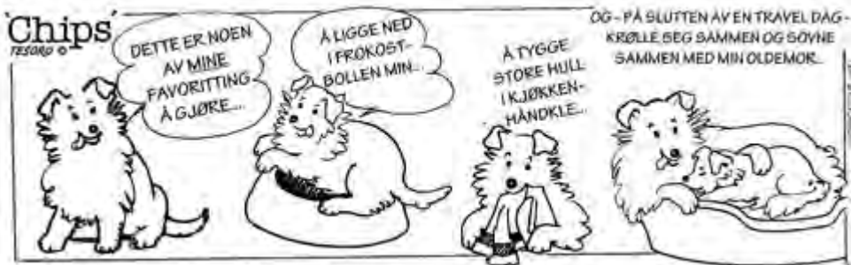
Tegning og tekst: Rosalind Allan, oversatt til norsk: R. Monsholm

Wang, Elizabeth Stasjonsveien 16, 2010 Strømmen