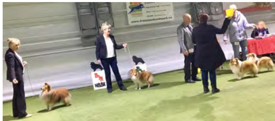
Beste Tispeklasse, f.v.: BIR: Ch Joyland's Magic Ambition, 2btk: Ch Zevista's A Link To The Past 3btk: Kjanto's Learning To Fly, 4btk: Ch Kjanto's Frozen Elsa