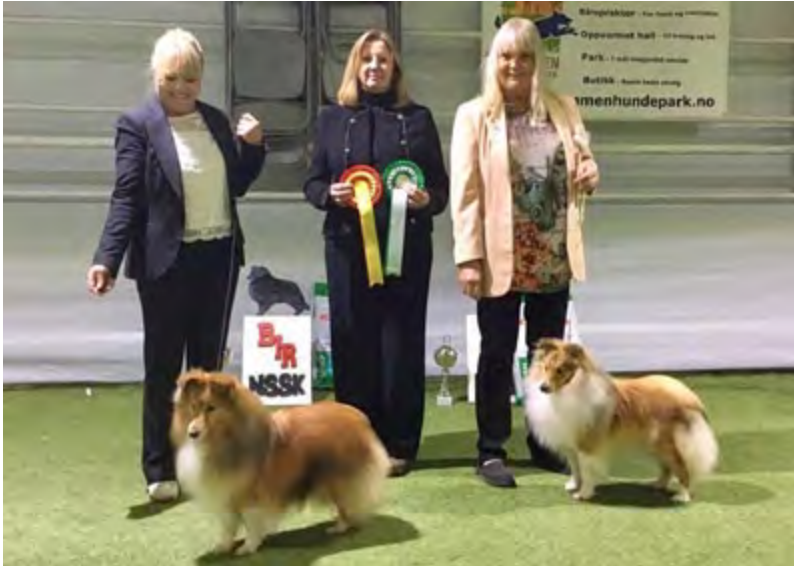
F.v.: BIR: Ch Joyland's Magic Ambition og BIM CERT: Shelteam Oh Boy