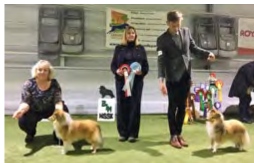
F.v.: CERT: Zevista's Talk Of The Town Res.Cert: Shellrick's Diamond Light