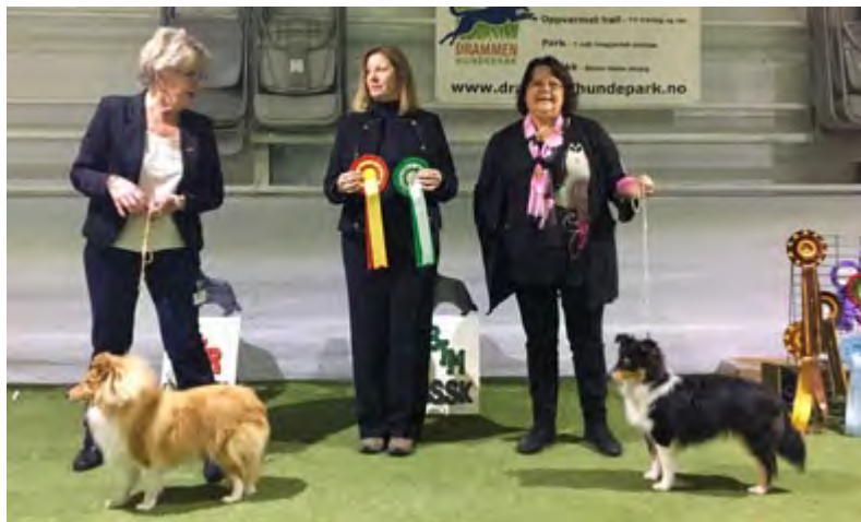
F.v.: BIR valp: Solisweet Sunshine Girl og BIM valp: Mosardi Bring Me Sunshine