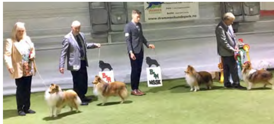
Beste Hanhundklasse, f.v.: BIM CERT: Shelteam Oh Boy, 2bhk: Ch Kjanto's Frozen Kristoffer, 3bhk: Ch Lundcock's Speed Limit, 4bhk: Ch Poulsgaards Hot Shot