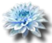
Nr. 1 Oppdretterklasse: St. Kilda

Nr 1 HP: Kennel St. Kilda Nr 2 HP: Kennel Microgården