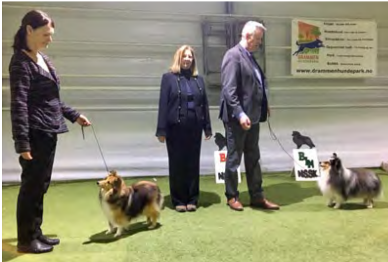
F.v.: BIR-veteran: Leeland Fairytale og BIM-veteran: Ch Minnett's Really Special