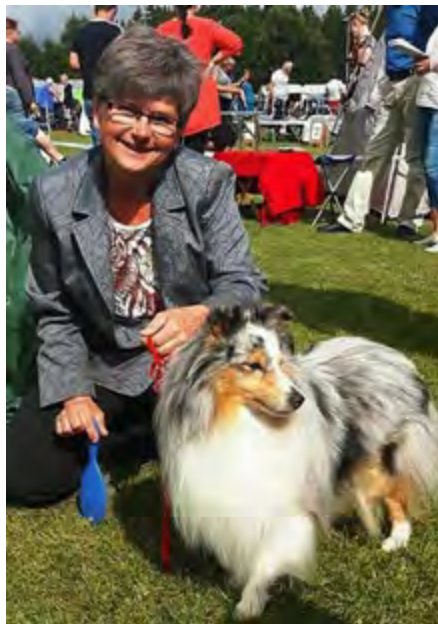
"Fersken" (bildet under)

(White Coastal Little Blue Aragon ex MD SM CH Lovesome Dream-like Rose)