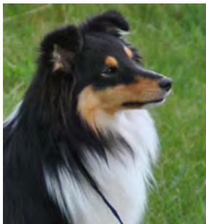
"Ella" (bildet over)